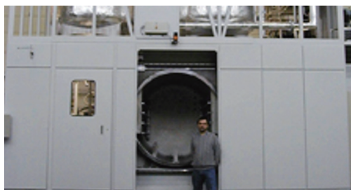
客户定制的RCTS碳氢清洗设备