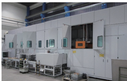
RUT多槽式双相清洗设备水基+溶剂